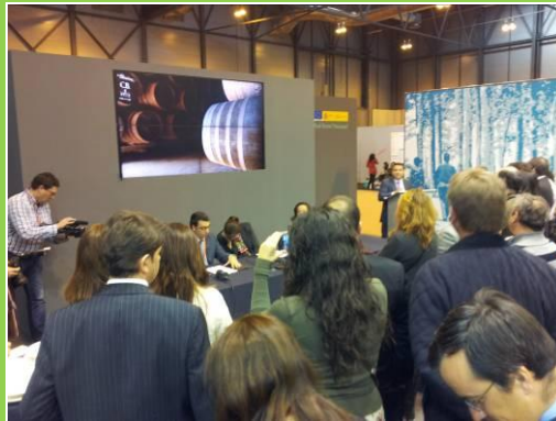
Presentación Club de Producto Rutas del Vino de España, a cargo de ACEVIN