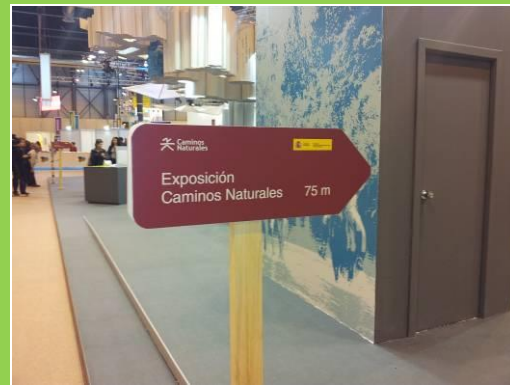
Espacio de la Red Rural Nacional, con las indicaciones sobre las rutas y caminos naturales existentes en el territorio